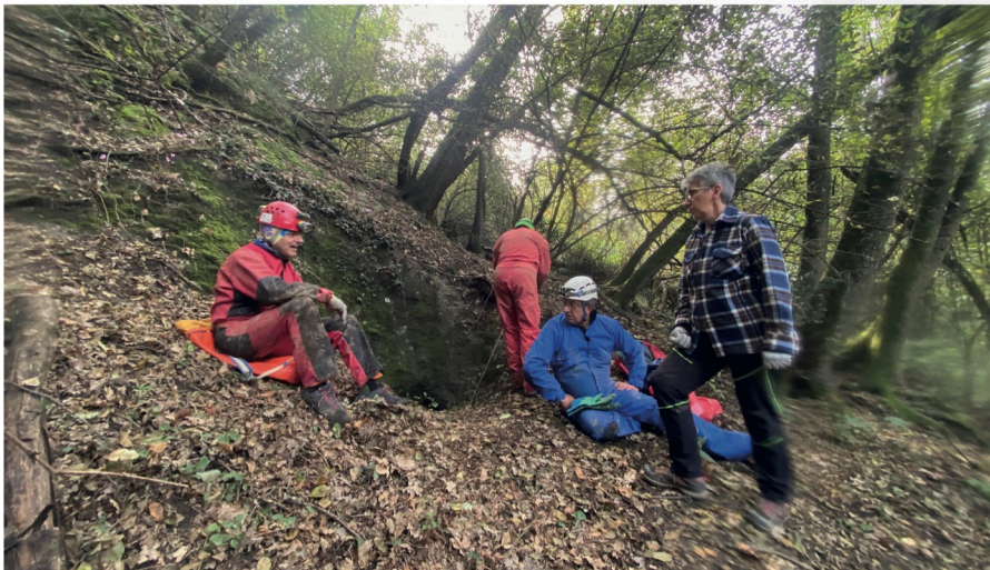
Risorgente Rio Groppo

Niente vino ma alla mia sinistra, verso il basso, delle bellissime stalattiti. Mi avvicino per cominciare le riprese da qui. Sistemo il cavalletto. Apro la borsa imbottita e impermeabile dove tengo la videocamera. Mi pulisco le mani dal fango con le salviette e con molta delicatezza preparo l'attrezzatura. Chiedo la luce. La luce è il momento più complesso. Sempre. Ma in grotta ancora di più. Partiamo dal nero e