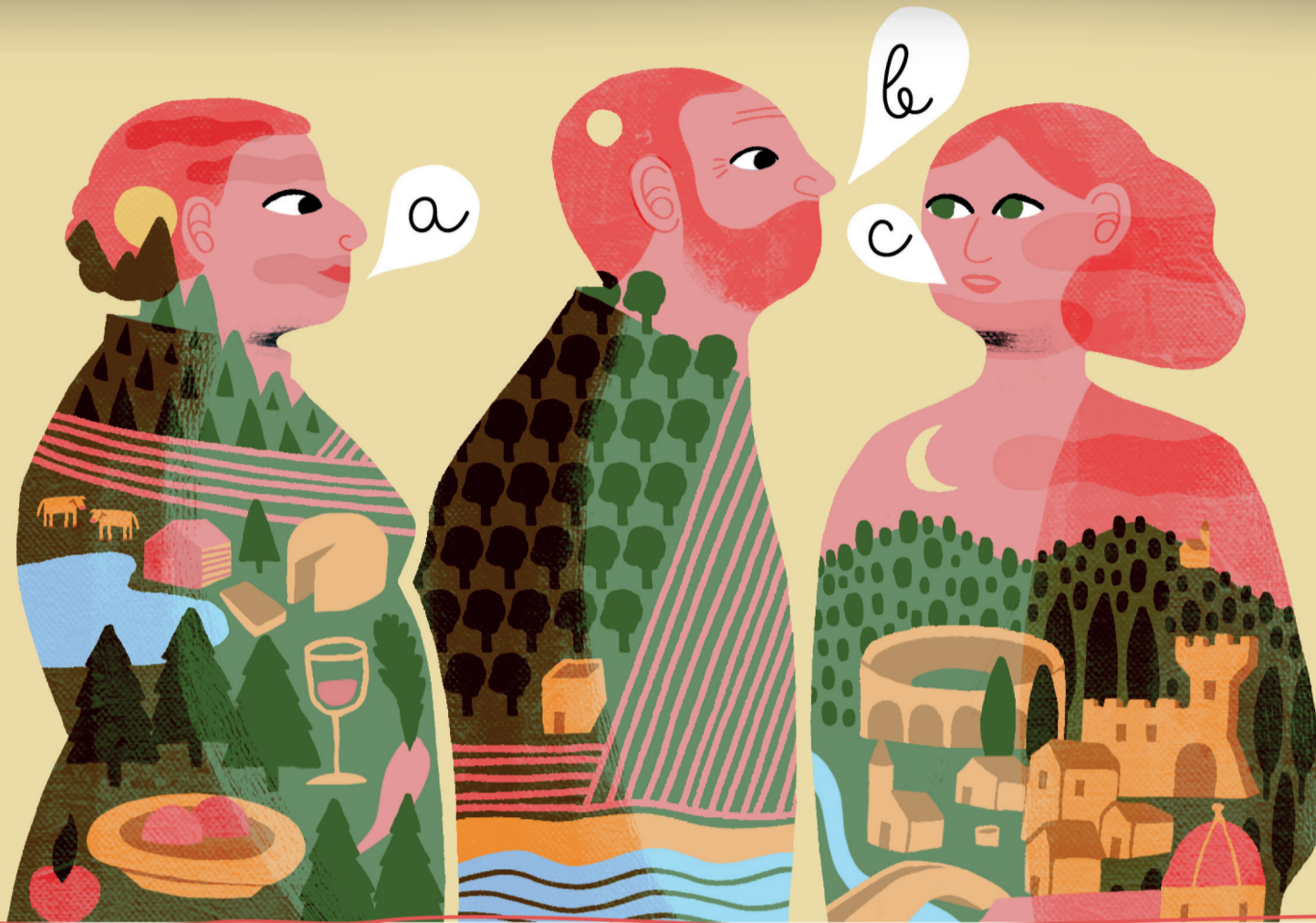
illustrazione: Monica Gori