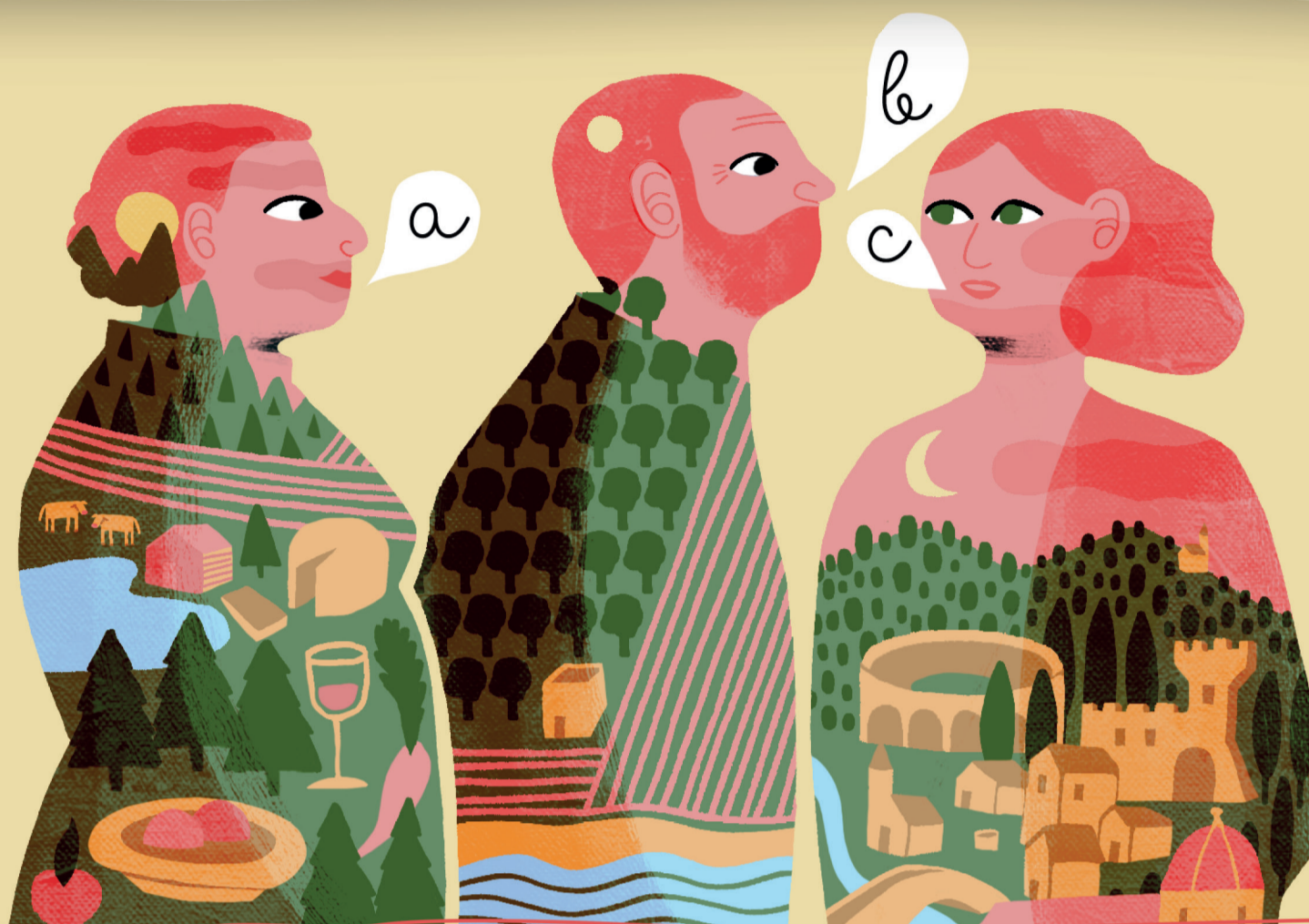
illustrazione: Monica Gori