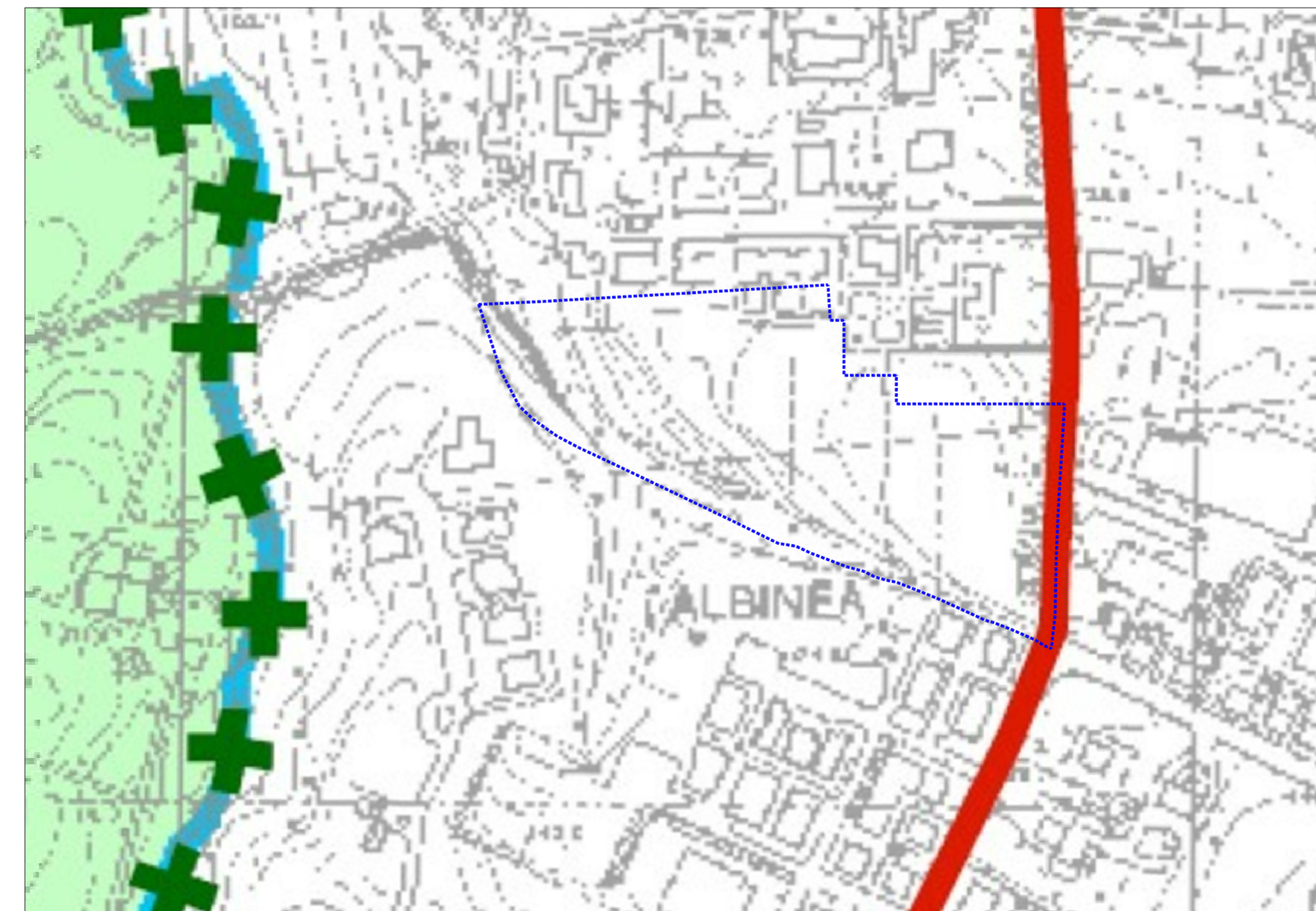
ESTRATTO PTCP - 2010 TAV. P5A AREA IN OGGETTO VIABILITA' STORICA PROGETTI E PROGRAMMI INTEGRATI DI VALORIZZAZIONE DEL PAESAGGIO ZONA DI PARTICOLARE INTERESSE PAESAGGISTICO AMBIENTALE