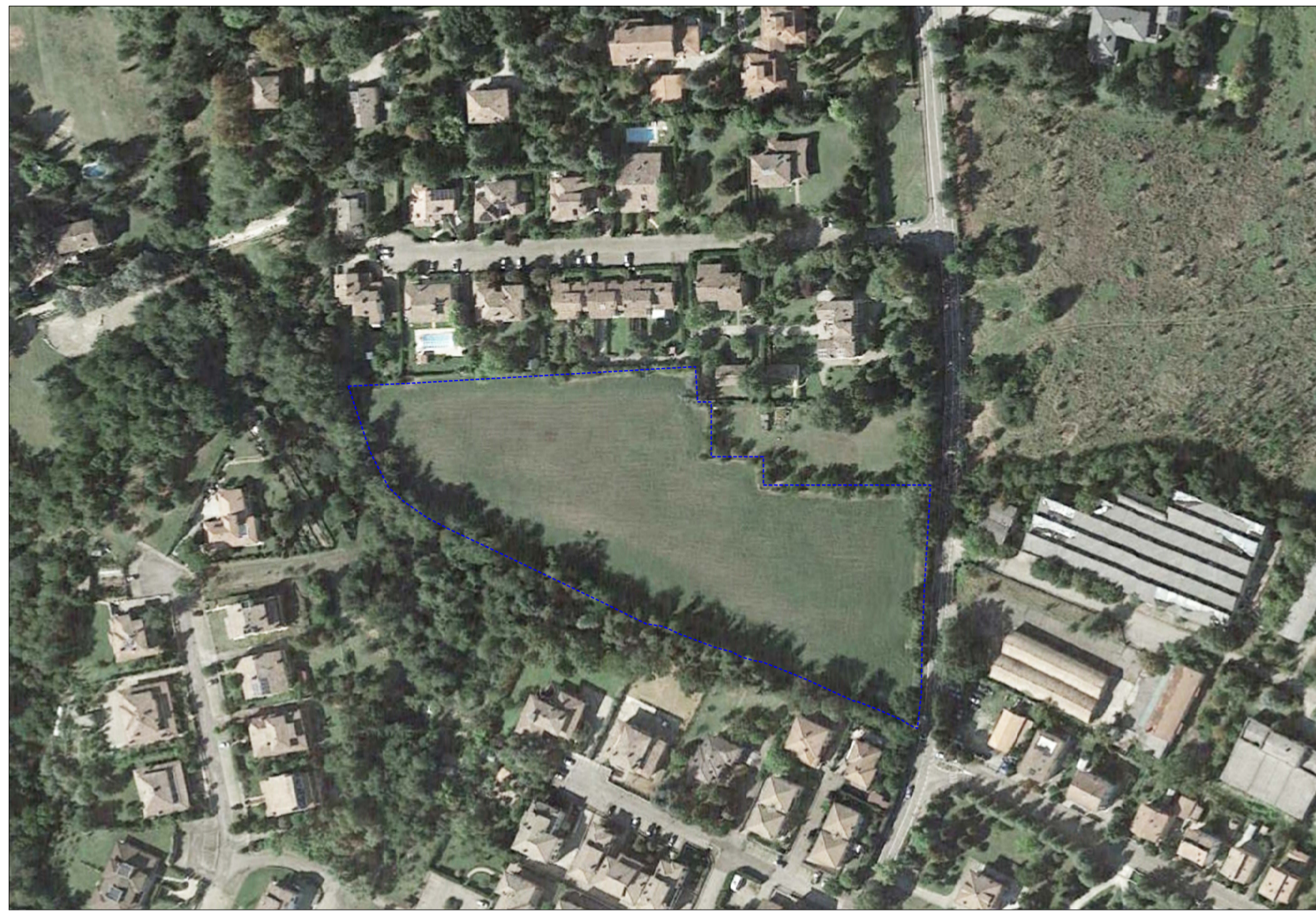
ORTOFOTO AREA OGGETTO DEL PIANO PARTICOLAREGGIATO PP23