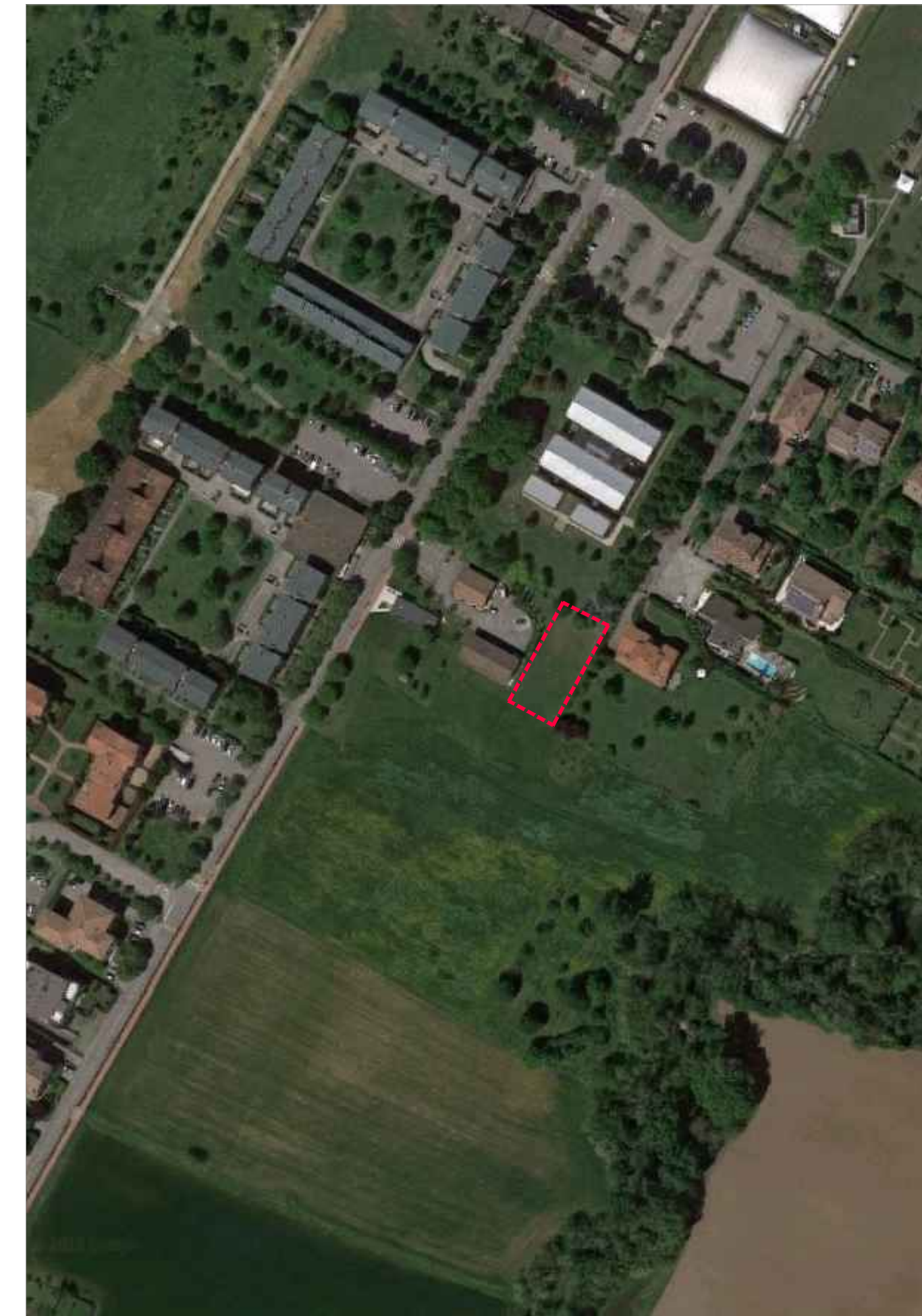
INDIVIDUAZIONE AREA SU ORTOFOTO