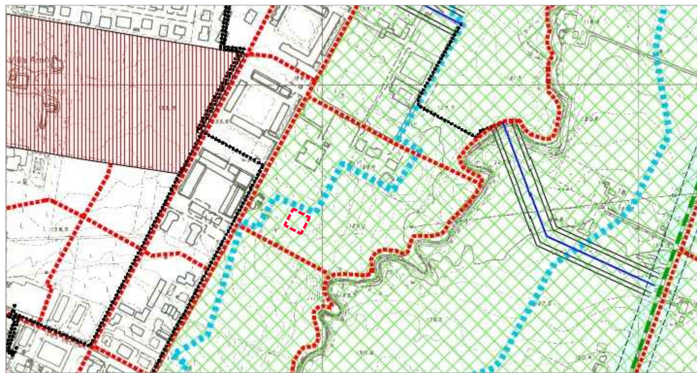
PRG DI ALBINEA - ESTRATTO TAVOLA 04_Viabilità e vincoli di legge D.Lgs. n.42 del 22/1/2004_Parte III, Titolo I_Capo II_Individuazione dei beni paesaggistici: - Articolo 136_Immobili ed aree di notevole interesse pubblico - Articolo 142_Rispetto della fascia di 150m da torrenti