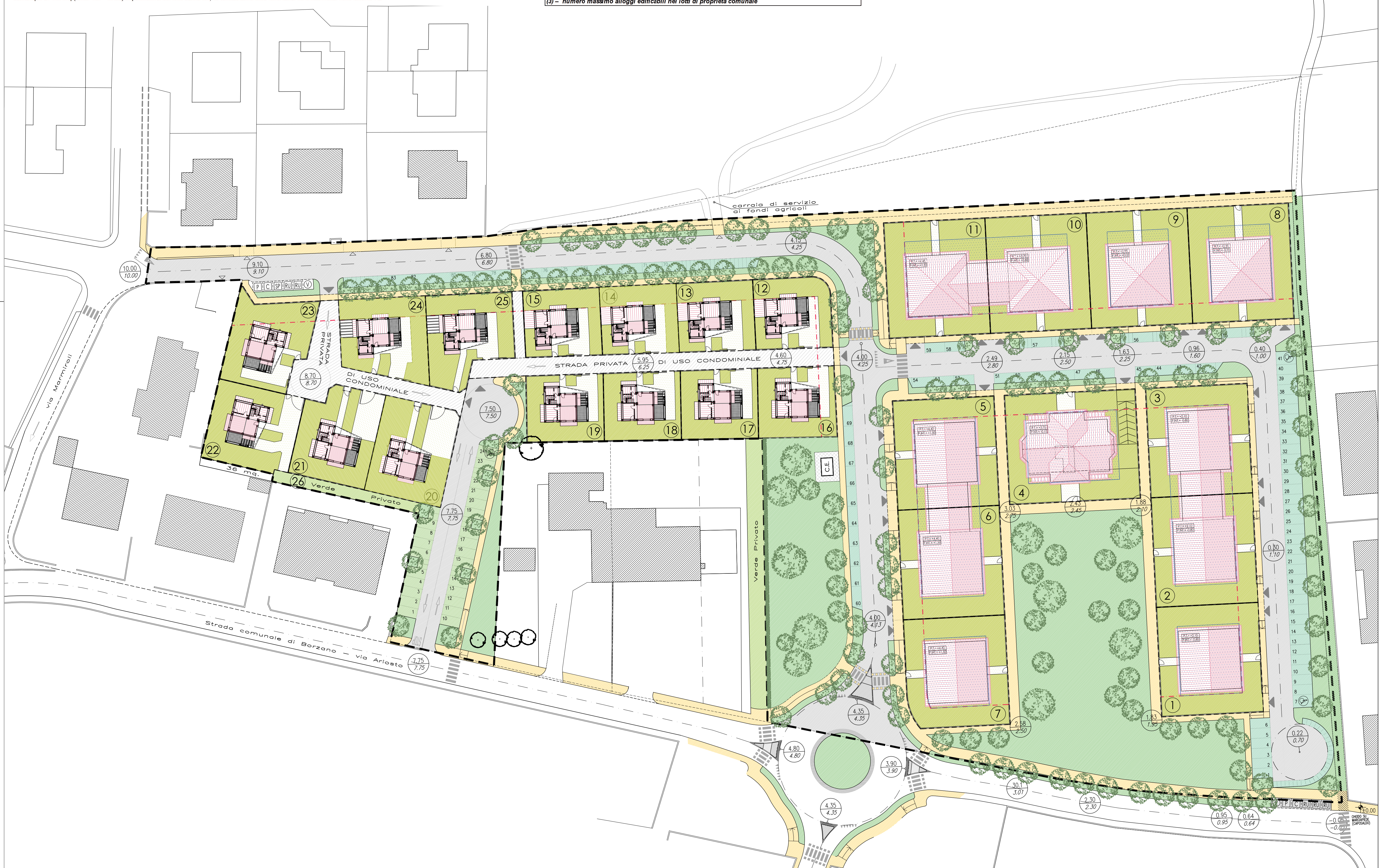
TAB. 1 bis - RAFFRONTO DATI P.R.G. VIGENTE, P.P. 28 VIGENTE (1° Variante), P.P. 28 2° VARIANTE senza delocalizzazione dei 734 mq. di S.u. Privata.