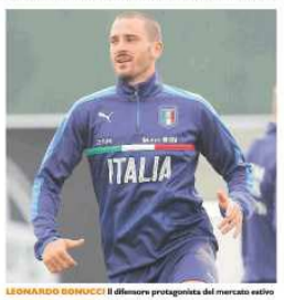
LEONARDO BONUCCI il difensore protagonista del mercato estivo

Calcio a 5 Testi contro il Cavezzo per il Kaos Reggio SECONDO un amichevole per il Kaos Reggio Emilia, in campo alle 19 al PalaBigli contro il Cavese. Dopo il 17-0 di sabato contro l'F.C. Salsomaggiore, la squadra modenese in CA si alza l'asticella per i 150-giorni, dal momento che i modenesi prenderanno parte alla prossima CA. L'occasione per il club kaos per mettere tutti gli effettivi a poco più di 10 giorni dal via della prossima serie A1, dove la squadra reggina vuole rischiare da protagonista: sarà ancora presente Vionica, alle prese con le discussioni dopo l'abbandono dell'ingegner Cristiano dal ruolo di tecnico, mentre sono da verificare le condizioni di Ammendino, tenuto a riposo qualche giorno fa. Nel frattempo ha iniziato la preparazione il Bagnolo (Ca5 serie B), che attende l'arrivo del capo-Prati e di Ferraboschi a Grosseto e Brindisi, il club gialloblù che ha ceduto in prestito Massimo, classe 1996, al già citato Cavese.