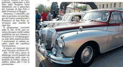
Festa di fine estate del pensionato San Giuseppe

Appuntamento domenica nella frazione di Pontenovo organizzato dalla Scuderia Terre Matildiche