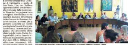
Una seduta del consiglio comunale di Campegine, il nuovo Comune creato a scissione da S.Iario.