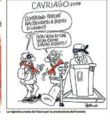
La giunta comunale di Cavriago per la promozione del evento.

Nell'ambito di cento anni di storia, Cavriago celebra la Rivoluzione. Il 25 agosto, alle 18.00, in piazza Lenin, si svolgerà "Rosso17", un evento che celebrerà il centenario della Rivoluzione. L'evento sarà organizzato dal Comune di Cavriago in collaborazione con il Circolo Tennis di S.Iario. Il programma sarà: concerti, spettacoli, giochi, stand di vendita di commestibili e aperitivi, proiezione della "Notte di San-Giuseppe".