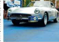
CASALGRANDE. Parte col botto e vestirà rosso Ferrari l'inizio della fiera di Casalgrande, in programma da sabato 9 a domenica 17 settembre. Il giorno dell'inizio della Fiera, dalle ore 17,15 circa, passeranno dal centro di Casalgrande 500 Ferrari provenienti da tutta Europa impegnate nel 70esimo anniversario del Rally to Maranello.