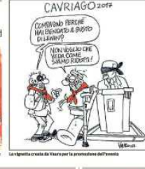
La kermesse della manifestazione.

Il Comune di Cavriago ha organizzato una manifestazione per celebrare la Rivoluzione. L'evento si terrà sabato 26 agosto in piazza Lenin, dalle 18 alle 24. Sarà intitolato "Rosso17" e sarà organizzato dal Comune di Cavriago in collaborazione con il Circolo dei pensionati. L'evento sarà arricchito da concerti, spettacoli e street food.