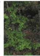
Un equipaggio del Soccorso alpino si è messo in cammino per raggiungere l'infortunato, poi l'elicottero della Croce Verde è atterrato nel campo del lago di Montebello. Succiso, 45enne si è procurato un profondo taglio a un piede

INFORTUNO al rifugio Città di Sarzana nell'Alpe di Succiso: un excursionista si è procurato un profondo taglio a un piede. Trovandosi nell'impossibilità di proseguire, gli amici hanno allertato la centrale del 118 scoccata che ha subito inviato l'elicottero di Parma, i tecnici del Soccorso Alpino della stazione Monte Cassia di Reggio, l'ambulanza della Croce Verde Alto Appennino e i vigili del fuoco di Castellino Monti. La persona ferita è stata curata sul posto dall'equipe medica dell'elicottero e trasferita in elicottero all'ospedale di Castellino Monti.