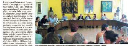
Una veduta del consiglio comunale di Campegine, il nuovo Comune di quattro castelle.

Una volta la frazione più popolosa del territorio, Campegine si è trovata a dover affrontare un processo di riorganizzazione amministrativa. Il consiglio comunale, in una decisione che ha suscitato polemiche, ha approvato il recesso da S. Ilario di alcuni servizi associati. La decisione è stata approvata con 12 voti a favore e 5 contrari. La minoranza ha criticato la scelta, ritenendola "assurda" e "inopportuna".