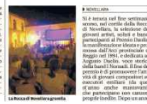
La Banda di Mangroovia presenta