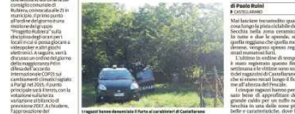
I furtivi hanno derubato il tuffatore di Castellarano

Castellarano, due biciclette ed altrettanti smartphone il bottino dei ladri all'altezza del Pescale