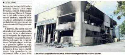
Il rogo ha distrutto il capannone dove, probabilmente, era conservata una grande quantità di legname. In alto: il cantiere di ricostruzione

Castellarano, martedì scorso il capannone dell'azienda Cavani è stato devastato da un incendio. Alcuni dipendenti lavoreranno "fuori sede", altri potrebbero essere impiegati in altre ditte