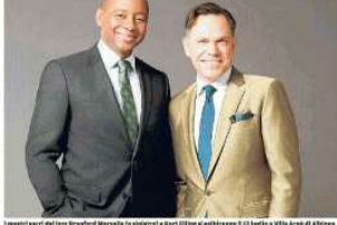
I nuovi nomi del jazz Branford Marsalis (a sinistra) e Kurt Elling (a destra) a Villa Arnò di Albinea

Una grandissima stella e un bellissimo contorno per festeggiare trent' anni speciali. Mancano pochissimi giorni all' avvio di Albinea Jazz 2017, trentesima edizione del principale festival jazzistico reggiano avviato nel 1988.