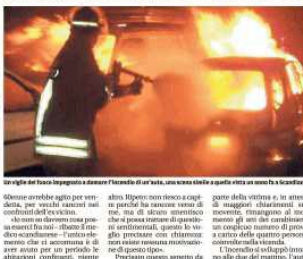
Un'auto del nuovo proprietario è stata distrutta da tre stranieri, una scena che è stata vista a Scandiano

di Adriano Anelli A Scandiano. «Non è stato un gesto di violenza, ma un atto di difesa. Ho visto il mio SUV distrutto da tre stranieri. Ho provato un senso di rabbia e di dolore. Ho chiamato il medico e ho parlato con lui. Ho detto: «Non so perché lo abbiano fatto». Lui mi ha detto: «Non so perché lo abbiano fatto». Ho detto: «Non so perché lo abbiano fatto». Lui mi ha detto: «Non so perché lo abbiano fatto».