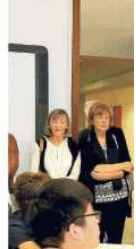
Un lavoro di supporto per gli alunni disabili

Anche l'investimento previsto da due lavori prevede cure agli alunni disabili attraverso gli insegnanti di sostegno e la figura di supporto. Sono previsti 60 i disaboli iscritti alla scuola con competenza. Per i nuovi studenti sono previste le disposizioni del governo che prevedono la loro integrazione in un istituto o in un centro diurno. Il centro diurno è in via Makallè. L'investimento è di 1,5 milioni. L'altro è in via Makallè. L'investimento è di 1,5 milioni.