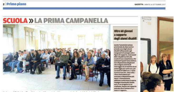
L'aula magna dell'istituto Scaruffi presenta in occasione della presentazione del nuovo piano scolastico da parte della Provincia di Reggio

Il costo totale di quattro milioni e 766mila euro è in gran parte riferibile ai cantieri principali, che ne assorbono quattro milioni e 81mila, mentre 602mila euro sono stati destinati alla manutenzione straordinaria e 83mila alla piccola manutenzione. In città l' intervento più impegnativo è ancora in corso sul palazzo di via Leopoldo Nobili, l' antico convento della Concezione che ospita il liceo artistico