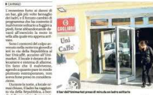
Il bar dell'Unicaffè, presso il via della Repubblica. In alto: il malvivente che svuota il cambiamonete

Caviaggio, ennesimo colpo notturno ai danni del bar di via della Repubblica. Scatta l'allarme. Il malvivente abbandona una moto e fugge a piedi con i soldi