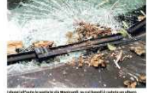
Un'auto danneggiata in via Manzoni, un'altra è caduta su un albero

Il Comune si oppone, la parola ora passa al giudice di pace