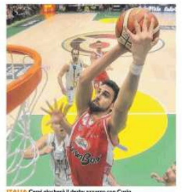
ITALIA Cervi giocherà il derby azzurro con Cervo

IN TV I QUARTI PLAYOFF AVELLINO-REGGIO EMILIA GARA 1 IN STREAMING SU GRISSINON CHANNEL GARA 2 POSTICPO IL LUNEDÌ ALLE 20,45 SU SKY SPORT 1