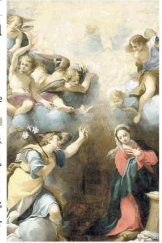
L'Annunciazione di Gualtieri