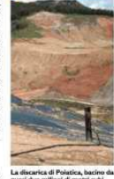
La discarica di Poitica, bacino da quasi due milioni di metri cubi