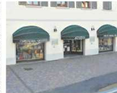
L'esterno della cartoleria profumeria presso d'assalto nella notte