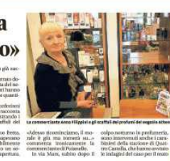
La profumeria dei ladri

MONTICCHIO «Bottino di 20mila euro» Una profumeria di Monticchio è stata saccheggiata da un gruppo di ladri. I furti sono stati commessi tra venerdì 12 e sabato 13 maggio. I ladri hanno rubato profumi, cosmetici e altri prodotti per un valore stimato di 20 mila euro. I furti sono stati commessi in un negozio di via S. Maria, subito dopo il centro storico.