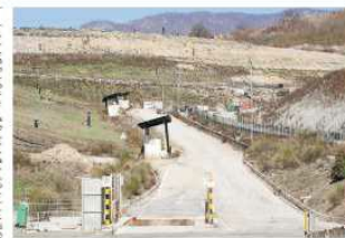
La discarica della discarica di Poaitica non è ancora chiusa. Gli addetti dell'Arma di Montagna e i volontari di Carpineti.