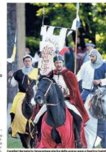
Cavalieri del corteo in processione sulla strada della notte verso il campo medievale

«Adesso ricominciamo, il morale è giù ma tornerà su...» commenta ironicamente la commerciante di Puianello.