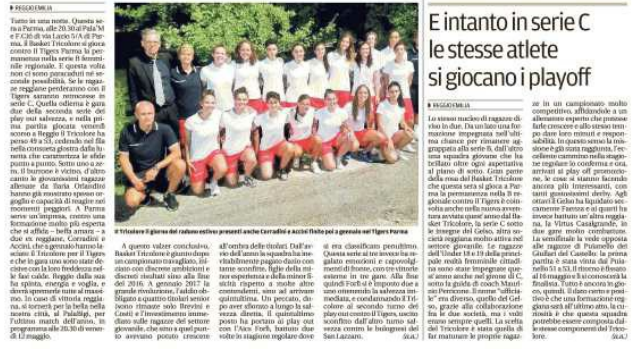
Il Basket Tricolore con il nucleo delle ragazze. In alto: la squadra di casa, in basso: la squadra di casa.