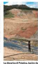
La discarica di Poiatica, bacino da cui due ruscelli di metri cubi