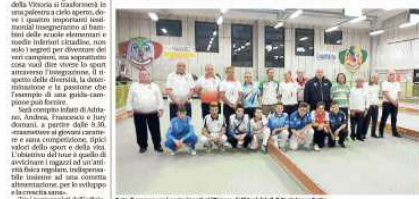
Foto di gruppo per i partecipanti al "Memorial Reculiani" di Castelnuovo Monti