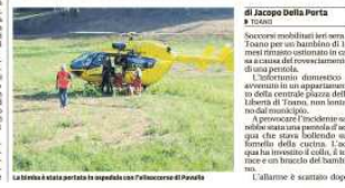
La bimba ustionata per la pentola in fiamme in casa di piazza della Libertà.

Toano: pentola sul fuoco, paura in una casa di piazza della Libertà. Il piccolo di 14 mesi in ospedale