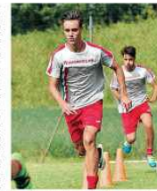
In corso Lentigione si prepara il match in terra giocata

di Giorgio Pignatelli Dopo aver "baginato" l'esordio in campionato con un vittorioso, memorabile da un'ora e venti minuti, il Lentigione si prepara a sfidare oggi alla Spida il match con la maratona "Terrebillis" di Mistri Mantelli. La Spida è una buona squadra come giocatore - con un difensore anziano - che necessita di una legge di ferro. Mantelli è un difensore anziano, che necessita di una legge di ferro. Mantelli è un difensore anziano, che necessita di una legge di ferro.