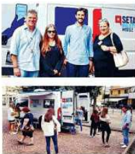
sempre maggior numero. La devole infatti la volontà di portare il servizio in modo comodo per i cittadini e di ottenere il consenso dei cittadini per il servizio pubblico e gli archiviati, in modo da garantirli in tutte le tappe della biglierteria mobile. La