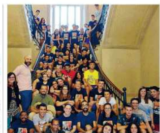
Adolescenti impegnati in lavori socialmente utili

Scandiano Cinquantotto ragazzi da 15 a 18 anni hanno partecipato al servizio di pulizia del territorio del Comune di Scandiano nei giorni di venerdì 1 e sabato 2 settembre. L'attività, organizzata dal Comune di Scandiano, con il patrocinio del Comune di Scandiano, ha visto la partecipazione di giovani del territorio, accompagnati da due educatori, con attività socialmente utili allo scopo di sensibilizzare i giovani alla cura del territorio e al rispetto per l'ambiente. L'attività ha visto la partecipazione di una ventata di giovani del territorio, accompagnati da due educatori, con attività socialmente utili allo scopo di sensibilizzare i giovani alla cura del territorio e al rispetto per l'ambiente. L'attività ha visto la partecipazione di una ventata di giovani del territorio, accompagnati da due educatori, con attività socialmente utili allo scopo di sensibilizzare i giovani alla cura del territorio e al rispetto per l'ambiente. La