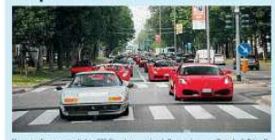
Un convoglio composto da ben 500 Ferrari attraverserà Albinea nel pomeriggio odierno. Si tratta di una parata memorabile organizzata dalla scuderia Tricolore e da Canossa Events in occasione del 70° anniversario della Rossa. Il convoglio di bolidi è partito tempo fa da Londra e ha attraversato Praga, Barcellona, Reims, Salisburgo, Ginevra, Francoforte, Roma, Montecarlo e Milano. Questa mattina, i piloti si sposteranno al parco ducale di Fiorano per il pranzo e alle 16 ripartiranno in gruppo per raggiungere il circuito di Fiorano. Il convoglio sarà scortato da 10 vetture dell'organizzazione e da 4 auto e 16 moto della Polizia Stradale. Il passaggio delle auto ad Albinea avverrà a partire dalle 16.50 circa; le Rosse arriveranno a Botteghe da Puianello percorrendo la strada provinciale 21, imboccheranno via Crocioni e, su richiesta dell'amministrazione, arriveranno sul lato nord di piazza Cavicchioni imboccando il suggestivo "Tira bussone" (strada stretta e caratterizzata da due tornanti). In questo modo i veicoli dovranno rallentare e questo, per chi vorrà osservarli da vicino, sarà un sicuro vantaggio. Il tutto ovviamente nel rispetto totale delle norme di sicurezza. Costeggiata la piazza i piloti si muoveranno in direzione Scandiano sulla provinciale 37. Durante la manifestazione il traffico resterà bloccato per non meno di 30 minuti, come da indicazione della prefettura di Reggio.