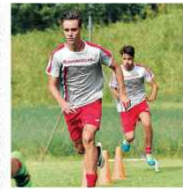
In casa Lentigione si prepara il match in terra piacentina

Il Lentigione anticipa: a Carpaneto si prospetta un match durissimo. Dopo aver "bagno" l'evento in compagnia con un vincente, importante da un po' di tempo, il Lentigione si prepara a sfidare il Carpaneto. Il match è stato organizzato da un gruppo di amici che hanno organizzato il match. Il match è stato organizzato da un gruppo di amici che hanno organizzato il match.