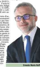
Ernesto Maria Ruffini