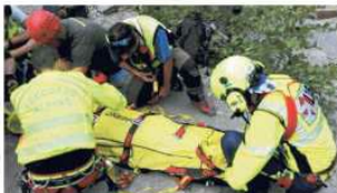
Incidente alla cascata del Goffarone. Nella foto: il soccorritore che si è chinato sulla cascata del Goffarone

Il giovane è stato ricoverato all'ospedale di Parma e la ragazza è stata ricoverata all'ospedale di Parma.