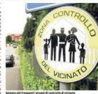
Sempre più frequenti i gruppi di controllo di vicinato

Cavriago Nata a Cavriago il primo asilo nido di controllo di territorio che - come ormai avviene in tanti paesi anche reggini - ha l'intento di controllare l'attività di tutti i cittadini, sia nelle abitazioni, sia nelle attività lavorative. Il gruppo Facebook "Cavriago Sicura" è nato da tempo in forma "privata" ed è aperto solo ai cittadini residenti in paese o che lavorano in territorio. Si è formato il 2 luglio 2015 a Cavriago. Attorno al nucleo del gruppo - a quella serata erano presenti i gruppi di Montecchio, Traversetolo, Modigliana e Sanfilippo. C'è sempre stato suggerimento di prospettare per il futuro il progetto per tutto il territorio cavriagino e non da un'esperienza che è nata il 2 luglio 2015 a Cavriago.