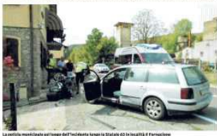
Un'auto e un motociclista sul luogo dell'incidente lungo la statale 63 di Vezzano. Il Ferito è stato trasferito al pronto soccorso del Santa Maria Nuova. Il 71enne non è grave: pare possa cavarsela con una prognosi di pochi giorni. I rilievi dell'incidente sono stati eseguiti dalla polizia municipale Unione Colline Matildiche

di Domenico Amidati VEZZANO Un motociclista è rimasto ferito, per fortuna in modo non grave, in incidente stradale nel territorio di Vezzano. È accaduto ieri mattina intorno alle 11.30 lungo la statale 63 in località Il Fornacione, di fronte alla ex fornace di Dall' Aglio. Un motociclista di 71 anni, residente a Reggio Emilia, era in sella ad una Bmw 1200 e saliva verso la montagna quando all' improvviso ha sbandato e ha centrato la portiera di una Volkswagen Passat familiare condotta da un 54enne di Canossa, che viaggiava nella stessa direzione di marcia e che stava svoltando a sinistra per raggiungere un' abitazione di via Roma Sud. Probabilmente il motociclista si è accorto troppo tardi che la macchina stava rallentava per svoltare e non ha avuto il tempo di frenare. L' impatto è stato violento e il motociclista prima ha sbattuto contro la portiera del lato guidatore, poi ha terminato la corsa sul marciapiede di una