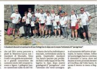
I pellegrini reggiani sulla via del Volto Santo. In alto: il gruppo in un momento dell'arrivo di Vezzano

Domenico Amidati VEZZANO I pellegrini reggiani sono alla volta di Lucca. Resterà parte a piedi in 10-12 giorni. In un altro tempo, sono venuti a Vezzano. Il gruppo si è sciolto in questo modo: a Montalbano il gruppo è stato diviso in due gruppi. Uno è andato a Vezzano la sera da Piazza San Vitale a Vezzano, la quale da Vezzano si ferma a San Vitale. Il gruppo si è sciolto in due gruppi. Uno è andato a Vezzano la sera da Piazza San Vitale a Vezzano, la quale da Vezzano si ferma a San Vitale. Il gruppo si è sciolto in due gruppi. Uno è andato a Vezzano la sera da Piazza San Vitale a Vezzano, la quale da Vezzano si ferma a San Vitale.