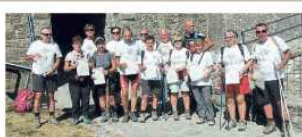
I viandanti davanti al santuario di San Pellegrino in Alpe con in testa l'attestato di "gringrus"

Gli cani continuano a essere portati fino al crinale. L'evento è stato organizzato dalla coop l' Ovile, in collaborazione con il Comune di Vezzano. Gli cani sono stati portati lungo il sentiero del crinale, dove sono stati lasciati liberi. L'evento ha attirato un gran numero di visitatori e ha contribuito a promuovere il territorio.