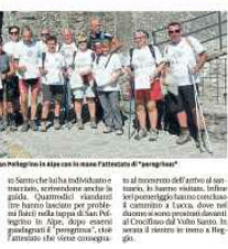
I pellegrini reggiani sulla via del Volto Santo. I pellegrini reggiani sulla via del Volto Santo.

I pellegrini reggiani sulla via del Volto Santo Vezzano. I pellegrini reggiani sulla via del Volto Santo. Vezzano. I pellegrini reggiani sulla via del Volto Santo.