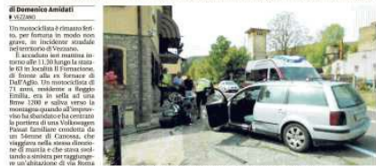
Un incidente stradale sul via Roma Sud di Vezzano. In alto: il motociclista che ha centrato la portiera della Volkswagen Passat familiare condotta da un 54enne di Canossa, che viaggiava nella stessa direzione di marcia e che stava svoltando a sinistra per raggiungere un' abitazione di via Roma Sud. Probabilmente il motociclista si è accorto troppo tardi che la macchina stava rallentava per voltare e non ha avuto il tempo di frenare. L' impatto è stato violento e il motociclista prima ha sbattuto contro la portiera del lato guidatore, poi ha terminato la corsa sul marciapiede di una abitazione situata proprio di fronte all' ex fornace. È stata una signora che vi abita a prestare in primi soccorsi al ferito e ad allertare il 118. Anche alcuni automobilisti si sono fermati sul posto, assieme a un amico del motociclista reggiano, che lo seguiva e che doveva fare un giro in montagna assieme al 71enne.

Vezzano, incidente stradale ieri mattina sulla statale 63 Fornacione Ferito in modo non grave un 71enne di Reggio che viaggiava verso la montagna