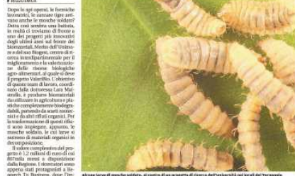
Alcune larve di mosche soldata, in corso di un progetto di ricerca dell'università nel parco del Tecnopolo