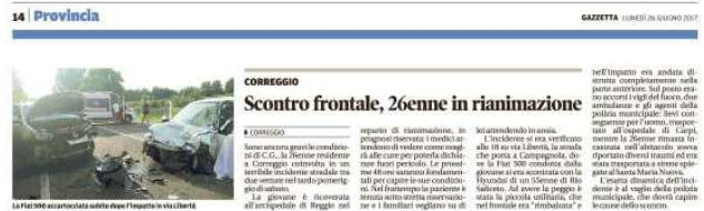
CORREGGIO Scontro frontale, 26enne in rianimazione

Un'auto a due porte è stata investita da un'auto a tre porte. L'incidente è avvenuto alle 18 su via Libertà, in un'area di parcheggio. L'auto a due porte, una Fiat 500 condotta da un 26enne, è stata investita da un'auto a tre porte, una Fiat Idea condotta da un 55enne. L'auto a due porte è rimasta ferma sotto osservazione e il conducente è stato trasportato in ospedale.