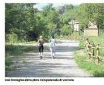
Una immagine della pista ciclopedonale di Vezzano

Vezzano, il cane l'ha azzannata al polpaccio. La donna dovrà sottoporsi a una cura antibiotica