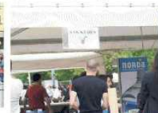
L'arcivescovo in corso Mazzini a Correggio