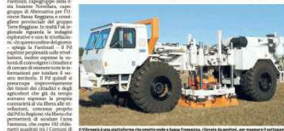
Il trivellatore a una piattaforma che comincia a essere forata, l'area di Fantozza, per scoprire il sottosuolo

Novellara: Cristina Fantinati critica la linea dei Democratici sull'area Fantozza «Ricordo ai sindaci e a Manghi che il loro collega di partito Bonaccini ha dato l'ok»