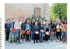
I 18enni di Castelnuovo Sotto con la Costituzione donata dal sindaco

Castelnuovo Sotto ha consegnato la Costituzione, dedicando il nome al sindaco di Maria Luisa King (Pd) della sua classe, un'occasione per la dimostrazione del suo impegno nella partecipazione e una pubblicazione illustrata in occasione del 12° premio internazionale della Costituzione. Il tutto ha avuto luogo sabato 25 aprile e ha coinvolto i giovani e gli studenti provinciali, così come hanno fatto parte le famiglie.