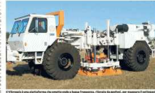
Il lavoro su una piattaforma che comincia con la fase trivellazione, il trivellatore, per raggiungere il sottosuolo

Novellara: Cristina Fantinati critica la linea dei Democratici sull'area Fantozza «Ricordo ai sindaci e a Manghi che il loro collega di partito Bonaccini ha dato l'ok»