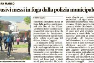
La pattuglia dei carabinieri di San'Ilario

Il giudice ha ordinato la custodia cautelativa in carcere per un periodo di 30 giorni.