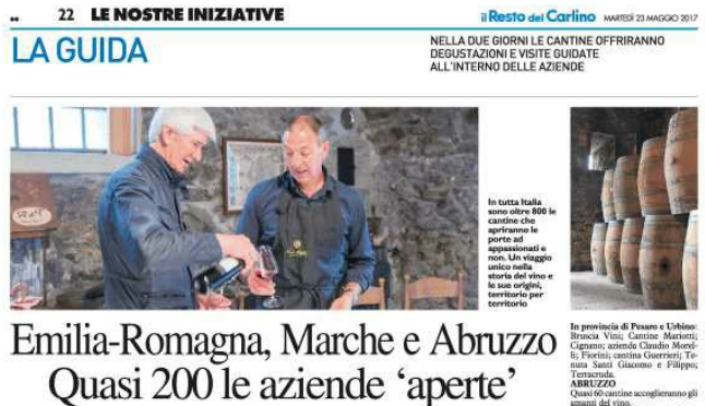
22 LE NOSTRE INIZIATIVE LA GUIDA il Resto del Carlino MARTEDÌ 23 MAGGIO 2017 NELLA DUE GIORNI LE CANTINE OFFRIRANNO DEGUSTAZIONI E VISITE GUIDATE ALL'INTERNO DELLE AZIENDE

MARCHE Settantotto le cantine aperte in tutta la regione.