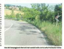
Uno dei lampeggianti distrutti dai vandali nella curva sulla Pratissole-Felina

Un'azione di vandalismo che ha distrutto i lampeggianti sui cartelli di segnalazione. La notizia è stata annunciata dal Comune di Casalgrande. I vandali hanno distrutto i lampeggianti sui cartelli di segnalazione. La notizia è stata annunciata dal Comune di Casalgrande.