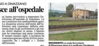
INCIDENTE Lo scalo ferroviario a Dinazano.

-CASALGRANDE- di riflessi è nata, per fortuna, determinando per attenuare le ferite causate dalla caduta. L'operaio, dipendente della Fachini Volante, caduto a terra ha subito diverse escoriazioni e una contusione alla schiena. L'incidente è accaduto verso le 16,30. Sul posto sono giunti in breve tempo un'ambulanza della Croce Rossa di Scandiano e, naturalmente, l'auto medica. L'incidente, dopo aver provato le prime cure,