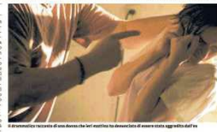
Il marito di una donna che si è vista aggredita dal marito, è stato arrestato e ha scontato una pena per violenza e stare lontano dalla moglie, ormai terrorizzata.

«Sono stato aggredito nella mia casa dal marito che aveva dei domiciliari e ha denunciato l'aggressione». Il marito è stato arrestato e ha scontato una pena per violenza e stare lontano dalla moglie, ormai terrorizzata. Dopo un sabato di pioggia, domenica e lunedì il sole ha portato molti visitatori divisi fra mercatini, ristoranti, bar, luna park, gare sportive e concertini, unite alla mostra degli hobbisti allestita dallo Spi Cgil nella palestra della scuola elementare Pezzani. Domenica sera si sono poi esibiti al parco Lavezza gli sbandieratori della Maestà della Battaglia.