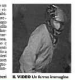
IL VIDEO Un fermo immagine