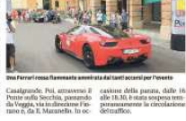
Una Ferrari rossa Ravenna arrivata al suo arrivo per l'evento

Una volta strasse le mani gli agenti milanesi. I malviventi sono diretti al distributore di Gattatico in una autostrada di notte. Hanno tentato di rubare l'incasso del distributore di Gattatico.