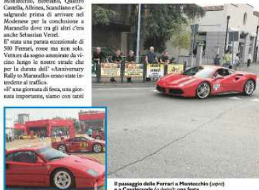
Il passaggio delle Ferrari a Montecchicchio (sopra) e a Casalgrande (a destra): una festa

La festa Ferrari si è snodata anche nei nostri paesi