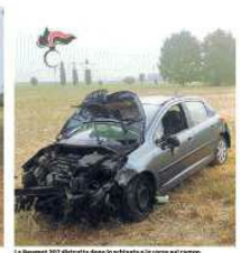
Il cavalletto stradale piomba nell'incidente, nella ripresa, l'auto della Honda si carica lungo la provinciale 12