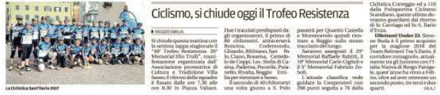
Ciclismo, si chiude oggi il Trofeo Resistenza

Due i tracciati proposti da chi organizza il percorso: il primo di 18 chilometri, interamente in piano, con partenza a Salvarano e arrivo a Castelnovo. Il secondo di 10 chilometri, con salite più impegnative, tra cui la collina di Castelnovo.