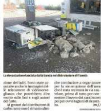
La devastazione lasciata dalla banda nel distributore di Gattatico

Una volta strasse le mani gli agenti milanesi. I malviventi sono diretti al distributore di Gattatico in una autostrada di notte. Hanno tentato di rubare l'incasso del distributore di Gattatico. Hanno tentato di rubare l'incasso del distributore di Gattatico.