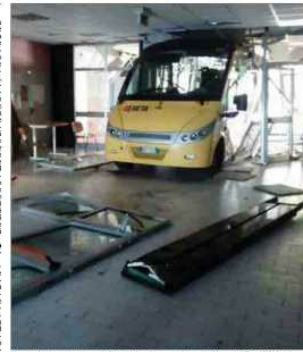
Uno dei due bus che si sono schiantati nella notte contro la scuola Meucci di Carpi (Modena)

La notte del bullismo è la storia della violenza e della contesa. Si fa il nome noia. Il bullismo è un fenomeno che si sta diffondendo in modo sempre più allarmante. In Italia, secondo i dati dell'Istituto di Studi e Ricerche "G. Rodolfo" dell'Università Cattolica del Sacramente, il 20 per cento dei ragazzi di età compresa tra i 12 e i 17 anni ha subito almeno una volta un episodio di bullismo. Il fenomeno è diffuso in tutte le fasce della popolazione, ma è particolarmente preoccupante perché si sta diffondendo anche tra i ragazzi di seconda generazione. In alcune medie della Val d'Enza, il bullismo è diventato un problema serio. I ragazzi sono spesso vittime di atti di violenza e di molestie. In alcune scuole, i ragazzi sono costretti a vivere in un clima di paura e di insicurezza. Il bullismo è un fenomeno che ha conseguenze gravi sulla salute fisica e psicologica dei ragazzi. In alcune scuole, i ragazzi sono costretti a vivere in un clima di paura e di insicurezza. Il bullismo è un fenomeno che ha conseguenze gravi sulla salute fisica e psicologica dei ragazzi.