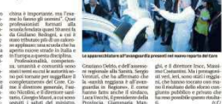
Le apparecchiature all'avanguardia presenti nel nuovo reparto del Core.

«L'inaugurazione del nuovo reparto di Gastroenterologia ed Endoscopia Digestiva è stata una grande festa per vedere il nuovo reparto».