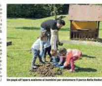
I papà all'opera insieme ai bambini per pulire il parco della Rodari

«Vendere più opere possibili mi piacerebbe e mi piacerebbe che i soldi vadano a chi ne ha bisogno. Ad Amatrice si sono trovati molti terremotati che hanno bisogno di soldi. Io ho fatto un corso di disegno e ho fatto un corso di disegno»