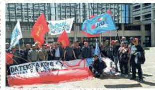
Le delegazioni di dipendenti della Terex venerdì davanti alla sede della Regione a Bologna

L'azienda di Lentigione è di quelle storiche. La fabbrica venne fondata nel 1960 da Luciano Fantuzzi, con produzione originariamente orientata alla fabbricazione di macchinari agricoli. Nel 1966 venne