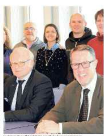
La delegazione di Friolzheimer accolta in Comune a Vezzano