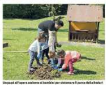
Un papà all'opera insieme ai bambini per realizzare il parco della Rodari

Un gruppo di genitori operai si è impegnato per un giorno nel progetto curato dalla scuola dell'infanzia della scuola Rodari.